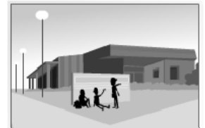
la scuola elementare "G. Puccini"