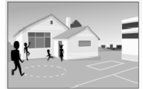
la scuola elementare "Carlo Piaggia"