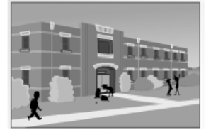
la scuola secondaria "A. Manzoni"