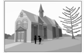
la scuola elementare "Savio"